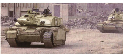
Britische Challenger 2 sollen kampfwertgesteigert werden.

Über den endgültigen Zuschlag wird im Jahr 2019 entschieden. Für den Bau eines Prototypen und Testzwecke soll jeder Auftragnehmer 25,8 Millionen Euro erhal-