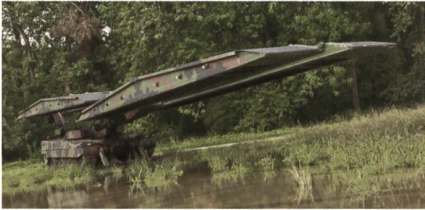
Das Brückenlegesystem Leguan.

Zwischen der deutschen Beschaffungsbehörde und Krauss-Maffei Wegmann wurde Ende 2016 ein Vertrag über die Lieferung von sieben Leguan-Brückenlegesystemen unterzeichnet. Mit dem Leguan lassen sich Gewässer und Geländeeinschnitte auch