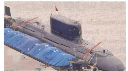
Chinesische U-Boote der «Yuan»-Klasse.

Pakistans Marine beschafft acht U-Boote aus China. Die ersten vier U-Boote sollen in China gebaut und 2022/23 ausgeliefert werden. Die restlichen U-Boote sollen dann mit technischer Unterstützung Chinas und Materialpaketen bis 2028 in Pakistan gebaut werden.