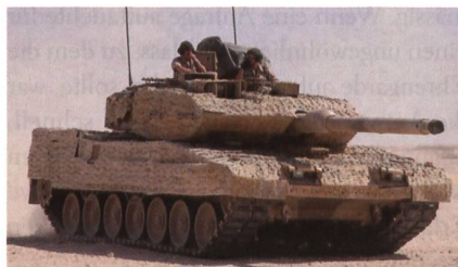
Die modernste Variante des Leopard 2.

Der Vertrag beinhaltet zusätzlich die Lieferung von 24 Panzerhaubitzen 2000 sowie 13 Dingo HD in drei Varianten und 32 Aufklärungsfahrzeuge Fennek. Hinzu kommen sechs Bergepanzer Wisent 2 und rund 100 Mercedes Benz Actros-4058-Panzer-