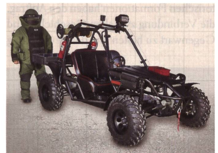
Geländegängiges Elektrofahrzeug LTEV.

Eine Akkuladung ermöglicht ca. drei Stunden Fahrt und Betrieb. Vier unabhängig voneinander arbeitende Federbeine mit hydraulischen Bremsen bringen den LTEV durchs Gelände. Der Buggy bietet Platz für einen vollausgestatteten Kampfmittelbe-