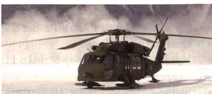
Mehrzweckhelikopter S-70 Black Hawk.

Sikorsky hat einen Vertrag für die Lieferung von sechs S-70i Black Hawk an die chilenischen Luftstreitkräfte abgeschlossen. Die Fuerza Aérea de Chile hatte ihre Wahl bereits im August bekanntgegeben und sich dabei für einen direkten kommerziellen Verkauf und nicht für ein FMS-Geschäft