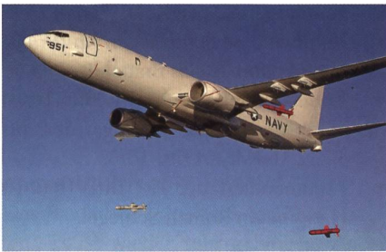
P-8A Poseidon beim Testabwurf.

Die Royal Australian Air Force konnte im November 2016 ihren ersten Boeing P-8A Poseidon Seeaufklärer und U-Boot-Jäger in Australien in Empfang nehmen. Australien hat im Februar 2014 bei dem US-amerikanischen Hersteller Boeing ihre ersten acht P-8A Poseidon in Auftrag gegeben,