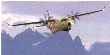
Das Rettungsflugzeug C295W.

Die kanadische Regierung hat die Airbus C295W für ihr Such- und Rettungsflugzeugprogramm ( Fixed-Wing Search and Rescue Program - FWSAR ) ausgewählt. Im Rahmen des FWSAR-Programms wird die kanadische Luftwaffe (RCAF) 16 für Such- und Rettungseinsätze konfigurierte C295W beschaffen. Der Vertrag im Wert von 2,4