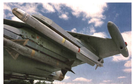
Flugkörper IRIS-T von Diehl Defence.

Aufgrund der zusätzlichen Einsatzmöglichkeit sieht Diehl Defence die IRIS-T heute als den «weltweit leistungsfähigsten Luft-Luft-Flugkörper kurzer Reichweite, der neue Massstäbe in diesem Marktsegment setzt». IRIS-T kann laut