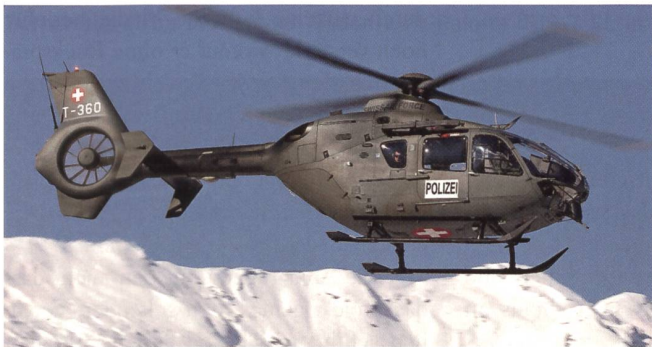
Der Transportheli EC-635 T-360, auch er im Polizei-Einsatz.