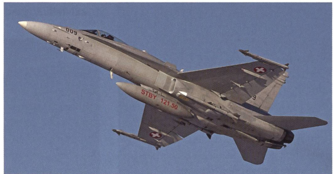
Der F/A-18 F-5009. Man beachte die scharfe Bewaffnung.