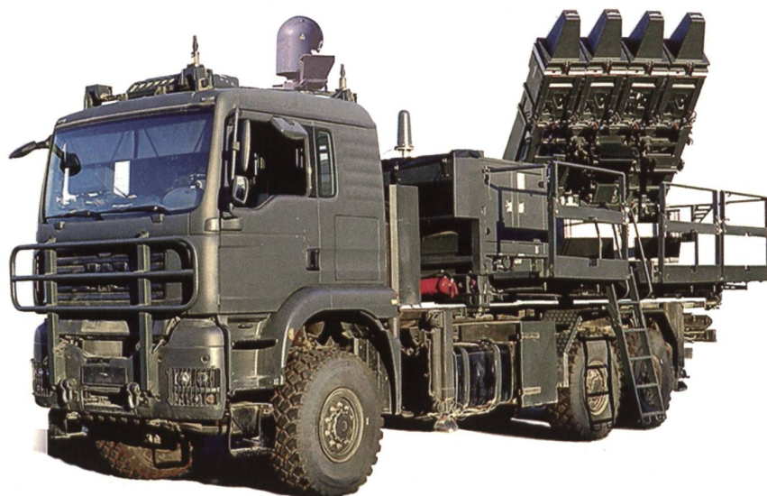
Spyder wurde von den staatlichen Firmen Rafael (Haifa) und IAI (Tel Aviv) gebaut.

Demgegenüber reichte Rafael aus Haifa ein Angebot ein, das in den Worten eines Beteiligten «jenseits von Gut und Böse» lag. Schon aus finanziellen Gründen sei es unmöglich gewesen, Spyder-MR weiter zu verfolgen.