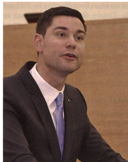
Grossratspräsident Benjamin Giezendanner.