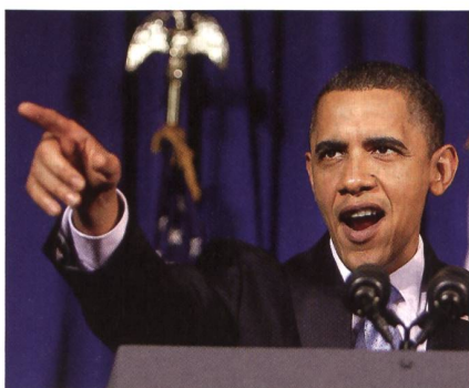
Prag, 2009: Obama fordert Abrüstung.

Demnach tragen in der Ebene von Salisbury die roten Angreifer in britischen Manövern russische Uniformen – und sie fahren auf russischen Panzern, was ungebührlich sei. Die Briten dementieren Shoigu zu 100%.