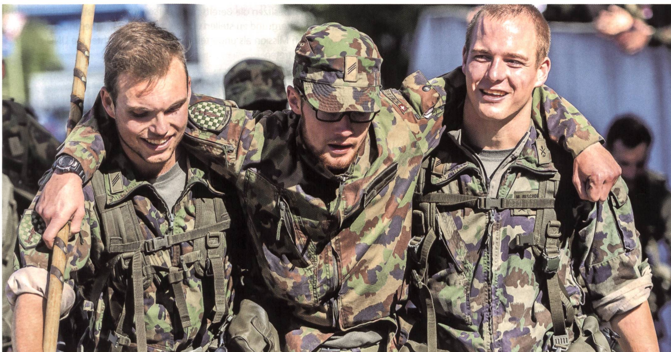
Kameradschaft. Der Schlüssel zum Durchhalten.