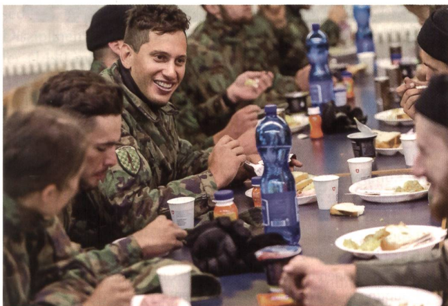
Für die Verpflegung wird die Zeit neutralisiert.

Dann ab zum ID, unter die Dusche und nach der pasta italiana unter die Decke – und am Freitag in den hoch verdienten Wochenendurlaub. +