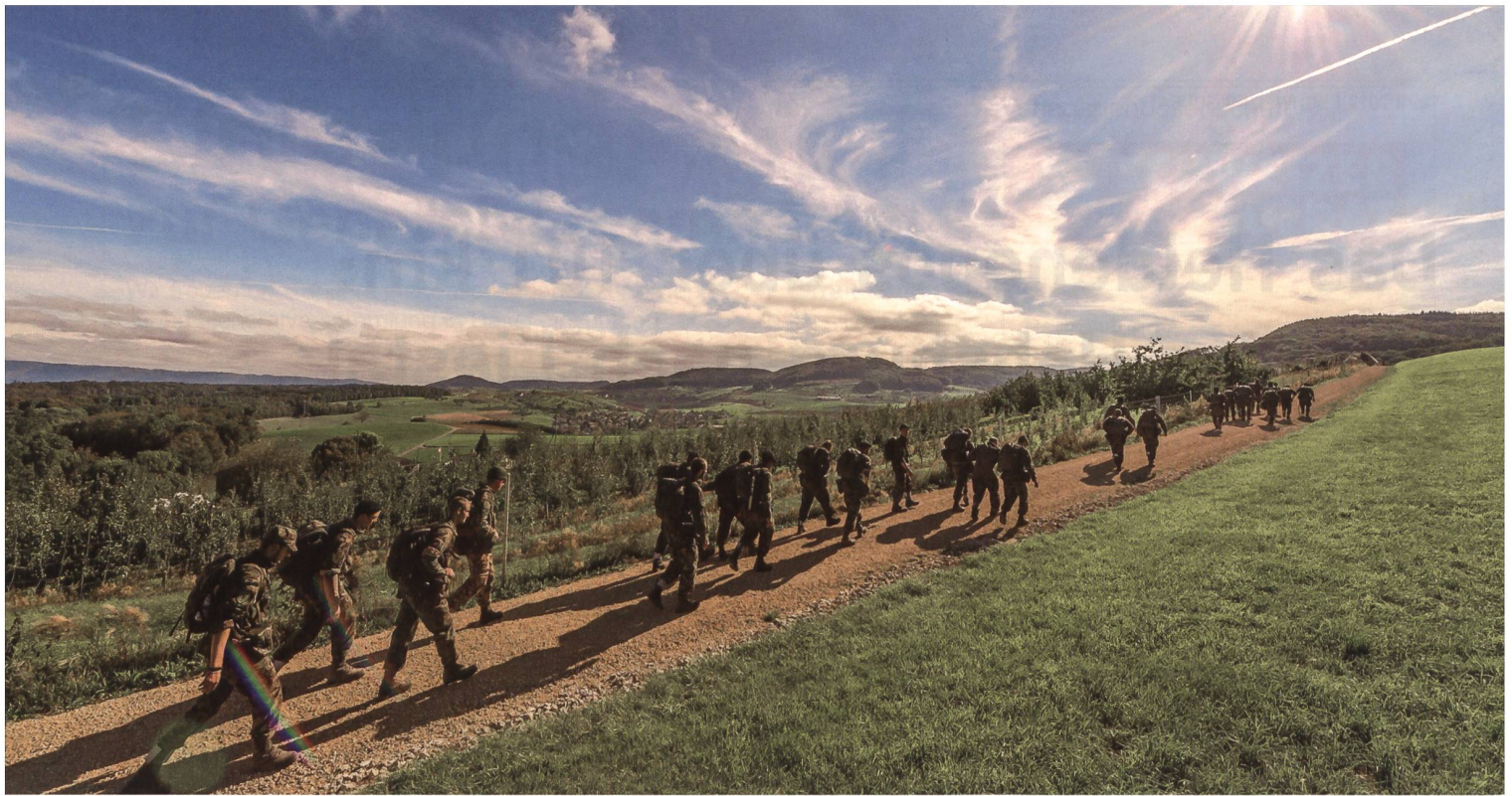
25 Mann und ein Befehl: Leichter Aufstieg, lockere Formation, noch bei Tageslicht.