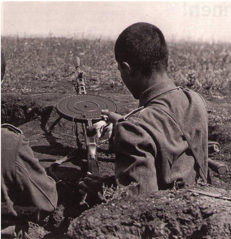
Maschinengewehr DP 28. Die Bewaffnung stammte zumeist aus Beutebeständen.

sich die Reihen gelichtet, es mangelte an Ersatz und den Partisanen war aus eigener Kraft nicht mehr beizukommen.