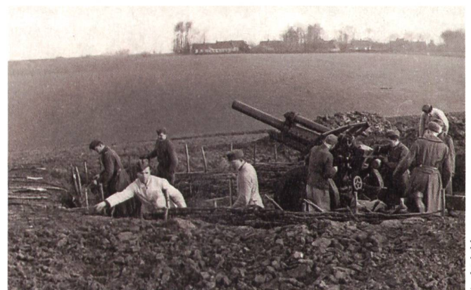
An der Kanalküste, Raum Fécamp/Saint-Valéry-en-Caux, Frühjahr 1944: Stellungsbau für eine russische 12,2-cm-Feldhaubitze der 3. Batterie der Ost-Artillerie-Abteilung 621.