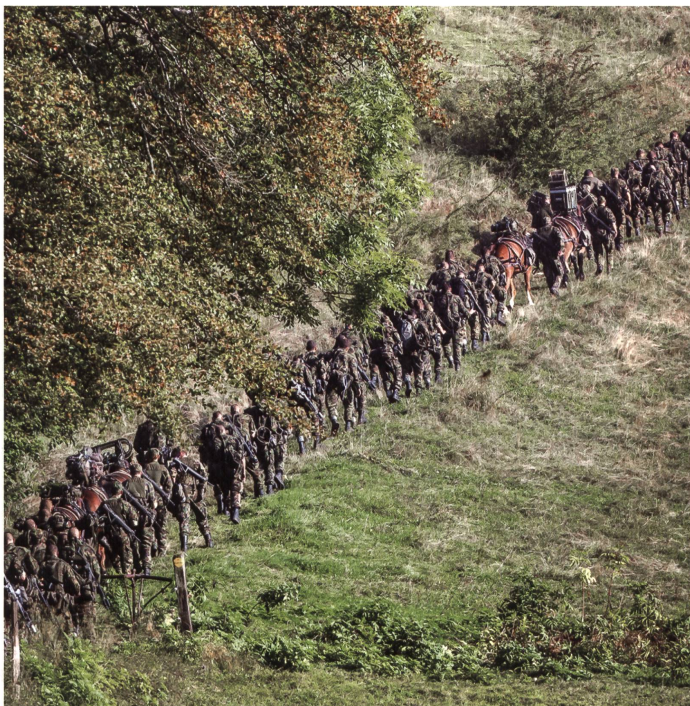
Das Nutt-Bild sagt mehr als 1000 Worte: Aufstieg, Zusammenhalt, Rückgrat der Armee.