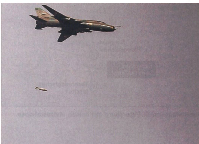
Ein Suchoi-22D der syrischen Luftwaffe wirft eine Bombe ab.

Eigentlich dürfte Syrien keine C-Waffen mehr besitzen. Nach dem Todesschlag auf Ghuta am 21. August 2013 verpflichtete sich Asad auf amerikanischen Druck, alle B- und C-Waffen zu vernichten. Er führte der OPCW, der Organisation für die Vernichtung chemischer Waffen, in Fässern