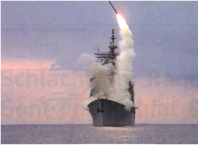
Abschuss eines Marschflugkörpers von der USS Porter.