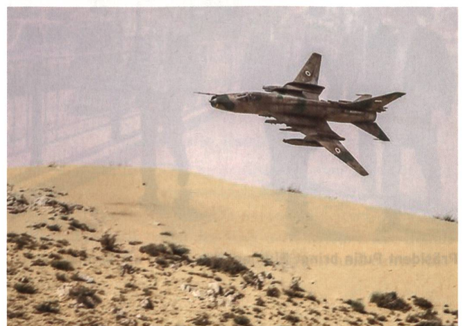
1982 lieferte die Sowjetunion Syrien vier Su-22D-Staffeln.