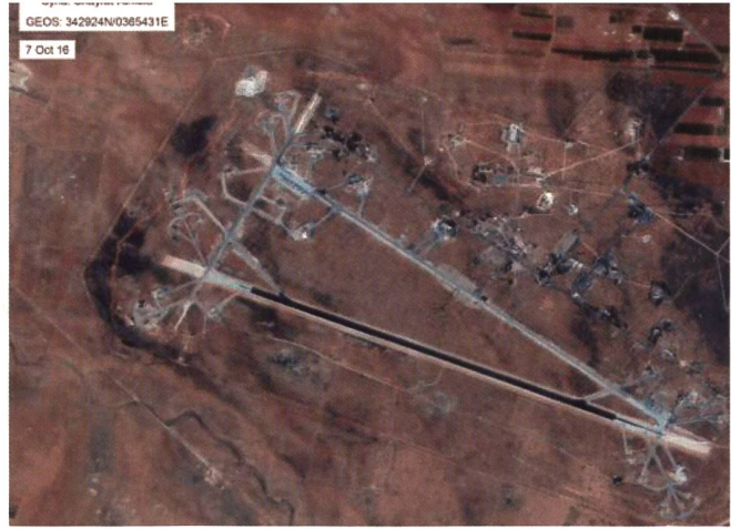
Der Flugplatz al-Shayrat, Stützpunkt einer Su-22D-Staffel.

verbotenen Kampfstoff zu, den die OPCW vernichtete. Nur berichteten israelische Quellen, Assad behalte C-Waffen.