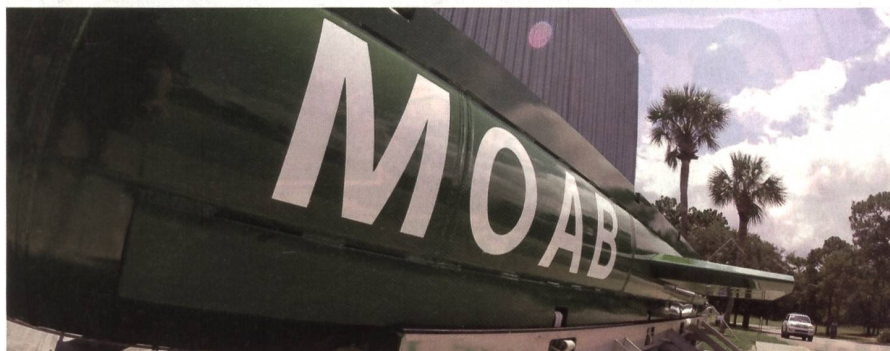
Über Afghanistan warfen die USA ihre 10-Tonnen-Bombe GBU-43 ab – Seite 46.