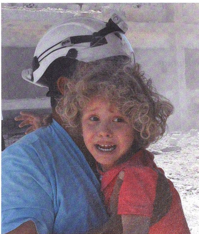
Syrien: Weisshelm rettet Kind.

In der Nacht zum 22. Juli 2018 holten israelische Spezialkräfte in einer einmaligen Aktion 422 eingeschlossene Weisshelme aus Syrien heraus.