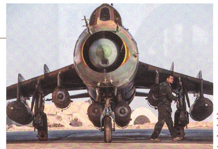
Syrischer Uraltbomber Suchoi-22.