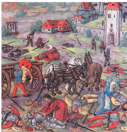
Temperalbild: Diebold Schilling

Trotz des Verlustes der 300 Thurgauer in Ermatingen stand nun eine Streitmacht von rund 1800 Mann bereit, den Schwaben in die Flanke zu stossen.