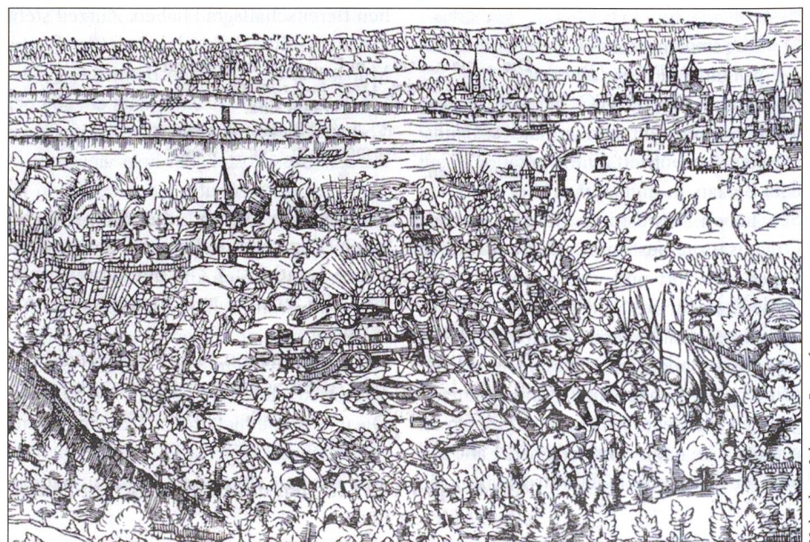
Die Schlacht bei Triboltingen. Von Westen, von links her, die Schwaben, von Norden die Eidgenossen. Links oben die Reichenau, rechts oben die Stadt Konstanz.

Er entschloss sich zu einem Zangenangriff auf Ermatingen, wo rund 750 Verteidiger Stellung bezogen hatten: 300 Thurgauer, 400 Fribourger und 50 Berner: