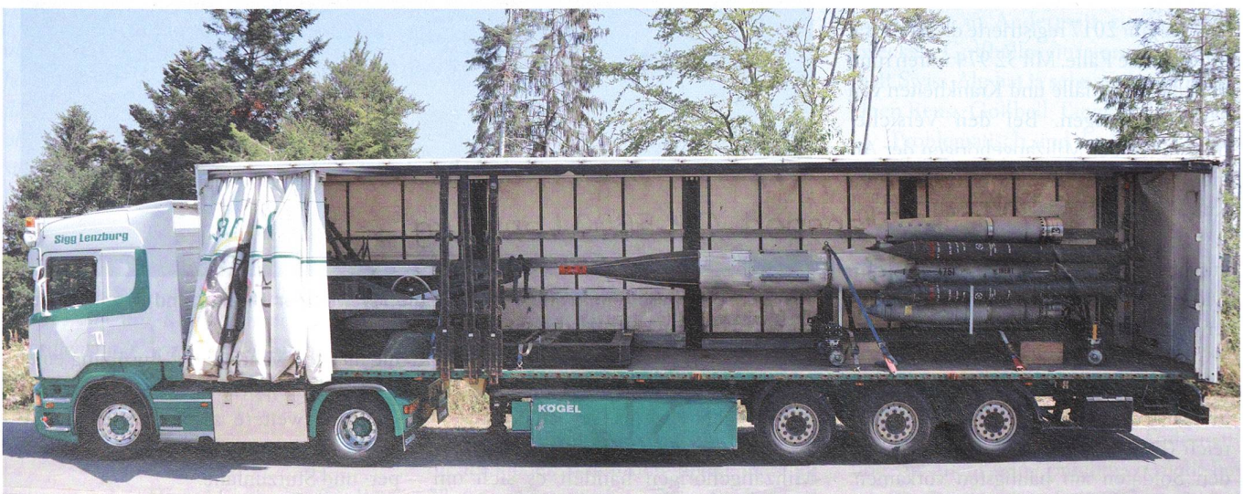
Bloodhound, eine klassische Waffe aus dem Kalten Krieg, der auch die Schweiz betraf.