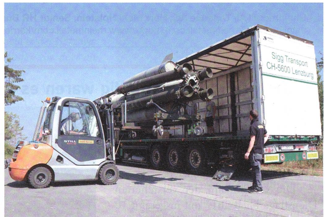
Mächtige Waffen werden im Lastwagen verladen.