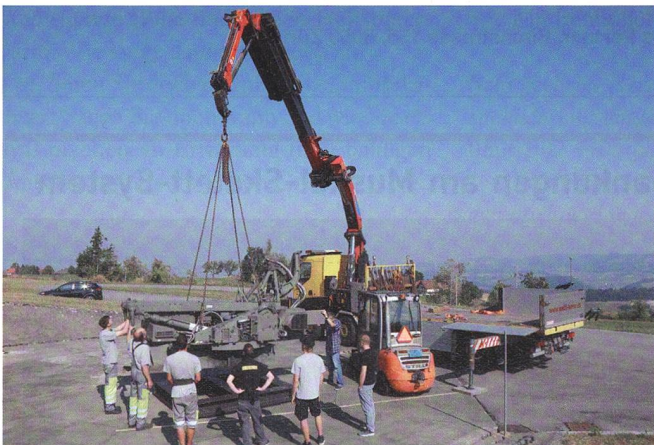
Der Pneukran hebt den Werfer an.