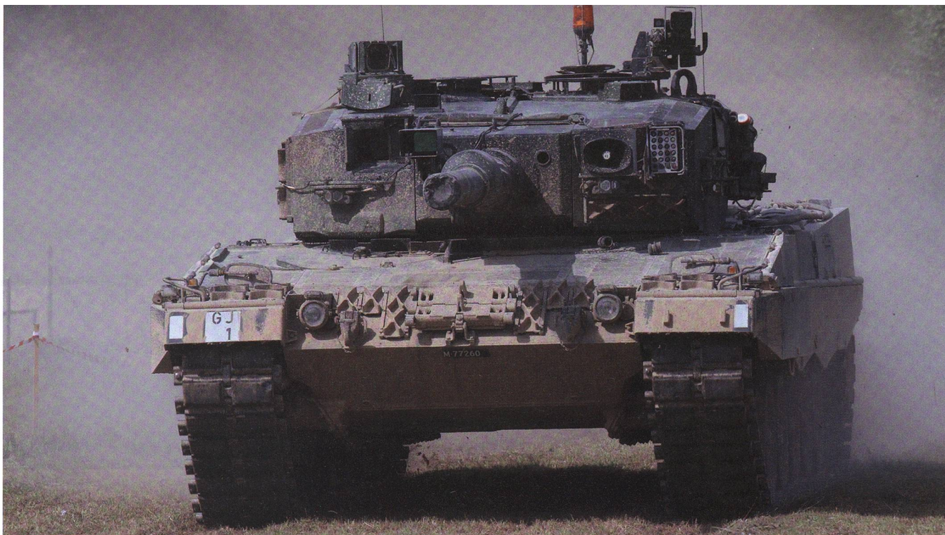
56 Tonnen Kraft und Mobilität: Panzer Leopard-2 im Angriff auf Nalé.