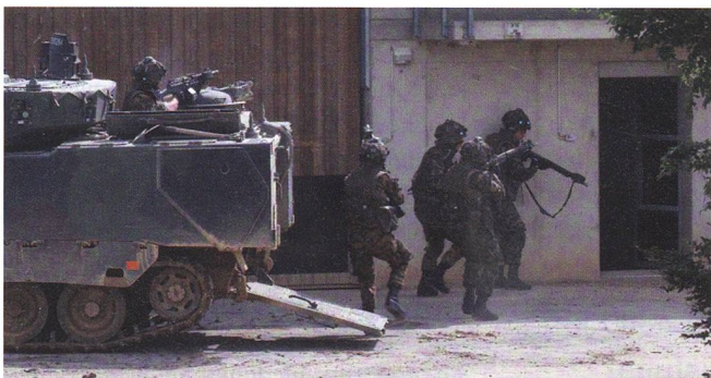
Angreifer nehmen im Nalé ein Haus ein.