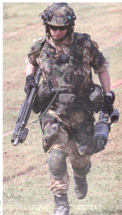
Kämpfer, ausgerüstet mit Laser-Simulation.

Regierungsrätin Barthoulot enthüllte ein schlichtes Denkmal. Die Betonskulptur zeigt die Symbole der Inf, Art, Pz und Pz Sap. Auf Plaketten sind die Namen aller Waffenplatzkommandanten eingraviert: Oberst i Gst Hüssy 1967 - 1969 Oberst i Gst Chavaillaz 1970 - 1974 Herr Metraux 1974 - 1979 Oberst i Gst Daucourt 1979 - 1983 Oberst i Gst Spinas 1984 - 1985 Oberst i Gst Rufer 1986 - 1988 Oberst i Gst Thiebaud 1989 - 2000 Oberst i Gst Godet 2001 - 2005 Oberst i Gst Guélat 2006 - 2008 Oberst i Gst Brulhart seit 2009