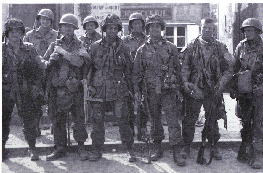
Unschärfes Bild aus der Normandie: Fallschirmjäger der 101. Luftlandedivision.

Präsident Kennedy beförderte ihn zum Generalstabschef der amerikanischen Streitkräfte. Präsident Johnson ernannte ihn zum Botschafter in Saigon, als sich Südvietnam des Vietcong-Ansturms zu erwehren suchte.