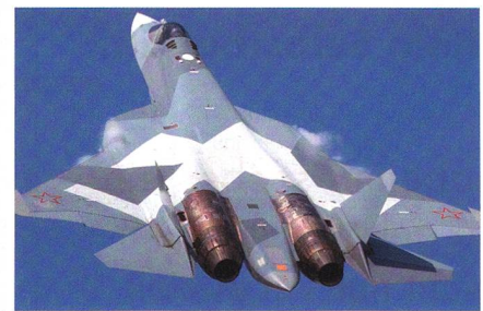
Start der Serienproduktion der SU-57.