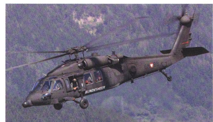
Zusätzliche Blackhawk für Österreich.

Das österreichische Bundesheer beschafft drei weitere Blackhawk-Helikopter. Die Zahl der Maschinen des Typs S-70A-42 wird damit von neun auf zwölf steigen. Der Sikorsky S-70 Blackhawk verfügt über zwei 1940 PS starke Triebwerke, was auch zur Hochgebirgstauglichkeit beiträgt. Ebenso gehört eine Enteisungsanlage für Haupt-