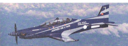
PC-21 für die Pilotenausbildung.

Sie ersetzen die TB 30 Epsilon und den Alpha Jet. Babcock wird acht Jahre lang eine Flotte von 17 Pilatus PC-21, Simulationsanlagen (zwei «Full Mission»-Simulatoren und drei Übungsgeräte), Missionsvorbereitungs- und Debriefingsysteme sowie die dazugehörige Infrastruktur bereitstellen. Jährlich sind etwa 11 500 Flug-