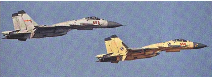
J-15 Flying Shark vor der Ablösung.

China will für seine Flugzeugträger neue Kampfflugzeuge aus eigener Entwicklung beschaffen. Derzeit werden auf den Flugzeugträgern trägergestützte Kampfflugzeuge vom Typ J-15 Flying Shark eingesetzt. Diese Flugzeuge basieren auf dem russischen Kampfflugzeug Su-33 Flanker