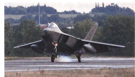
Landung einer F-22 in Spangdahlem.

Die U.S. Air Force hat eine F-22 Raptor Staffel nach Spangdahlem verlegt. Die F-22 sind für einen mehrwöchigen Trainingsaufenthalt nach Deutschland geschickt worden. Die Luftüberlegenheitsjäger sollen zusammen mit anderen Einheiten vor Ort und bei anderen NATO-Partnern Übungseinsätze fliegen. Mit den Trainings-