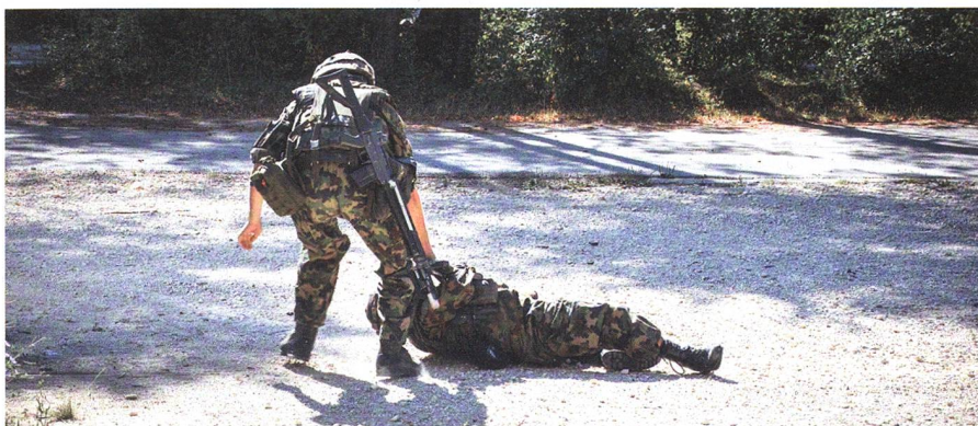
Mit Spezialprogramm schulte die Pz Kp 12/1 den Sanitätsdienst – Seiten 26–29.