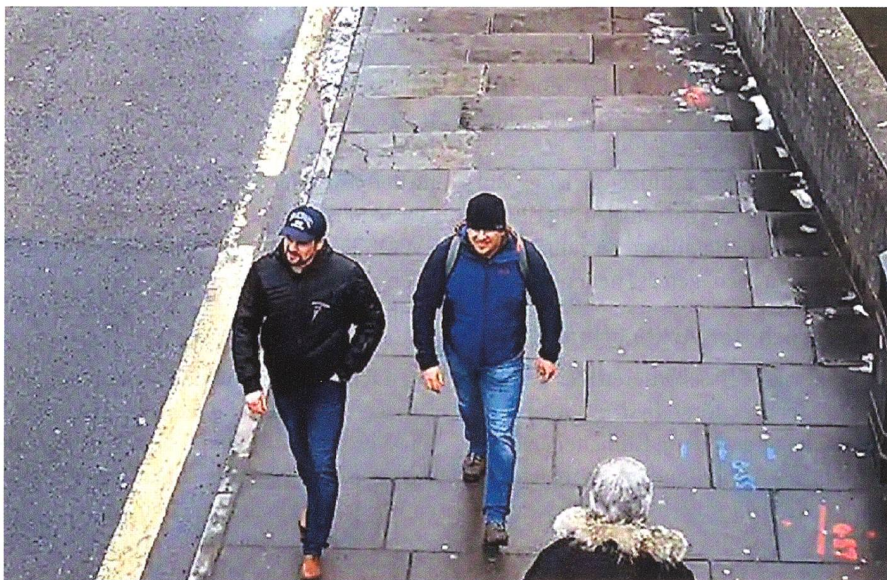
Das unscharfe Bild der Metropolitan Police zeigt Tschepiga alias «Ruslan Boschirow» (links) und «Alexander Petrow» in der Kathedralenstadt Salisbury.

Seit am 4. März 2018 in Salisbury der russische Doppelagent Sergej Skripal und seine Tochter fast vergiftet wurden, steht die Welt vor einem Rätsel: Wer schmierte Skripal das Nervengift Nowitschok an die Haustüre? Wer steht hinter dem letztlich stümperhaften Anschlag? Westliche Medien behaupten: Es waren die russischen GRU-Agenten «Petrow» und Tschepiga alias «Boschirow». Russland dementiert heftig in aller Form.