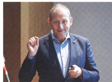
Der Generalleutnant Mart de Kruif.

Generalleutnant Mart de Kruif schilderte seine Entscheidung, einen Antrag auf Luftunterstützung abzulehnen. Dar-