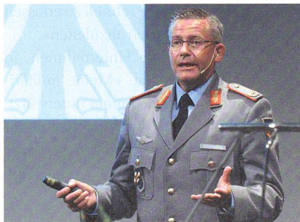
Der Brigadegeneral André Bodemann.

Da das Entscheiden in kritischen Situationen im Kontext der Armee vor allem