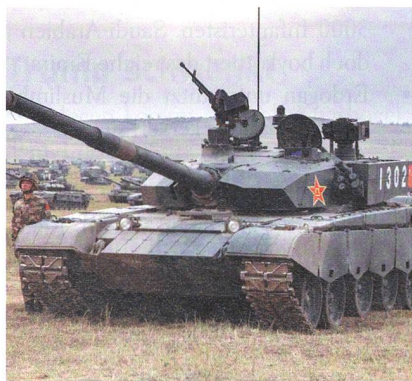
Der chinesische ZTZ-99-Kampfpanzer Nummer 1302 an der Manöverparade.

Das britische Institut für Strategische Studien (IISS) bestätigt die offensive Ausrichtung der russisch-chinesischen «WOSTOK 2018»-Manöver und wartet in einer umfassenden Analyse mit Details zur ausserordentlichen Ausdehnung der Übung.