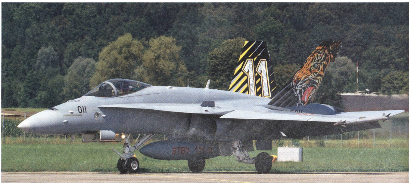
«Pro Militia»: «Die Vollausrüstung aller Verbände ... muss rasch umgesetzt werden, insbesondere ... NKF und BODLUV.»