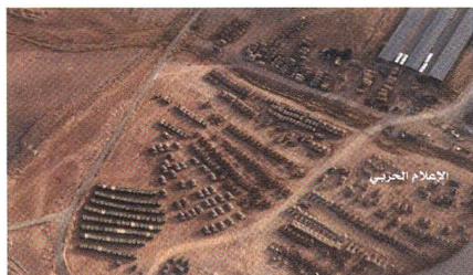
4. Mai 2017: Fahrzeuge von USA, GB und Jordanien südlich an der Grenze.

Al-Tanf ist ein taktisch bedeutender Grenzübergang am jordanisch-syrisch-irakischen Dreiländereck mitten in der Wüste.