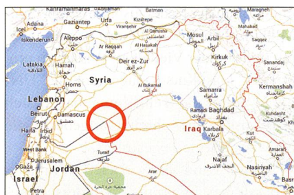
Al-Tanf (roter Kreis) beherrscht die Strasse von Bagdad nach Damaskus.

Die Invasion begann am 15. Mai 2017 und umfasste zum Gros der jordanischen Truppen je eine amerikanische und briti-