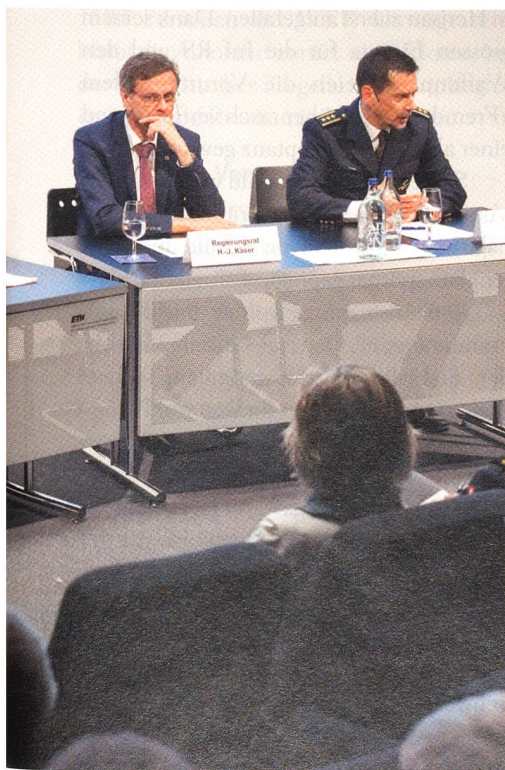
ETHZ, Regierungsrat Hansjörg Käser, Polizei-