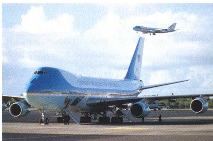
Air Force One kommt nach Kloten.

Trotz seiner Anti-WEF-Rhetorik im Wahlkampf kündigte Präsident Trump am 9. Januar überraschend seinen Besuch am WEF 2018 an. Das Schweizer Sicherheitsdispositiv wird – für die Hauptträger Polizei und Armee – auf eine neue Probe gestellt. Ob die Randalierer die Festung Davos knacken, ist unsicher. Hingegen rächten sie sich schon in Zürich und Bern, nachdem sie in Landquart Niederlagen erlitten hatten. Die Verantwortlichen sind höchst aufmerksam, jedoch gelassen.