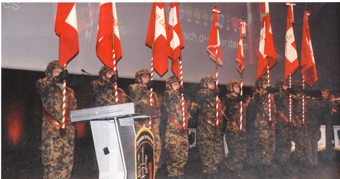
Die Feldzeichen der neuen Territorialdivision 1 in Montreux.

Der Ter Div 1 sind folgende acht Bat unterstellt: Ter Div Stabsbat 1, Inf Bat 13, Inf Bat 19, Schützen Bat 1, Schützen Bat 14, Geb Inf Bat 7, G Bat 2, Rttg Bat 1. Hinzu kommen die Koord Stelle 1 sowie das Kdo Patrouille des Glaciers.