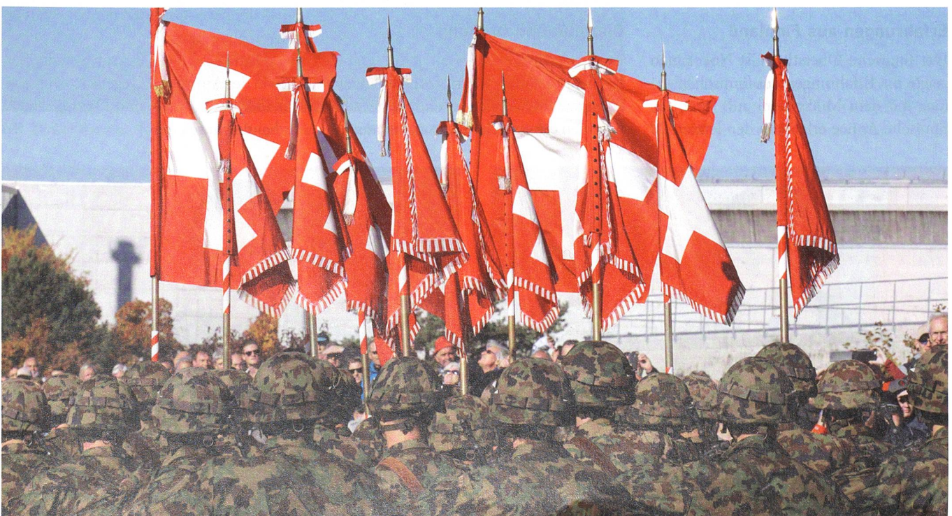
Feldzeichen am Armeetag 2016 in Thun. Unsere Armee ist bereit.