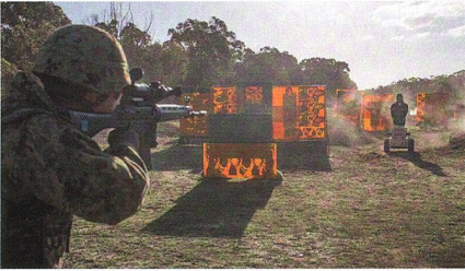
Autonomes Ziel von Marathon Targets.

Marathon Targets hat mit der T30 ein neues Mitglied der autonom beweglichen Ziele für das Gefechtschiessen mit Handwaffen vorgestellt. Unter Nutzung von Segway-Technik können sich 3D-Figuren im Zielgelände frei - auf vorprogrammierten Wegstrecken oder selbst gesuchten Wegen