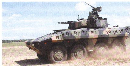
Das Active Protection System von ADS.

Die ADS Gesellschaft für aktive Schutzsysteme mbH (ADS GmbH), bekannt für zuverlässige und präzise aktive Hard-Kill-Schutzsysteme, hat das weltweit erste Active Protection System (APS) nach höchster Sicherheitsklasse der DIN/ISO 61508 entwickelt. Dieses neue ADS-Gen3 soll noch im Jahr 2018 seine Zertifizierungen nach DIN/ISO 61508 SIL 3 (Safety Integrity Le-