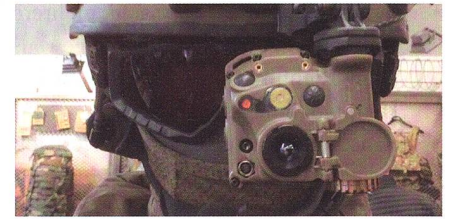
TILO-3 - kleinstes WBG am Einsatzhelm.

Nachdem die Andres Industries AG im letzten Jahr bereits die kleinste Wärmebildbrille der Welt mit einer Sensorauflösung von 320x240 Pixeln vorstellen konnte, präsentiert sie dieses Jahr mit der TILO-6 den jüngsten Spross dieser Produktfamilie. Die extrem kleine Wärmebildbrille mit einer Länge von nur 5,8cm und einem Gewicht von unter 130g verfügt nun in der leistungsstärksten Version über eine Sensor-