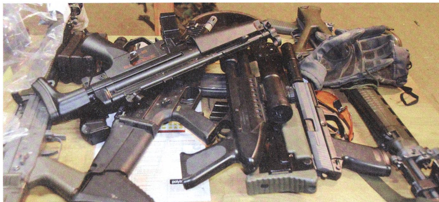
Beschlagnahmtes Volpodinger Material, vornehmlich Schusswaffen!