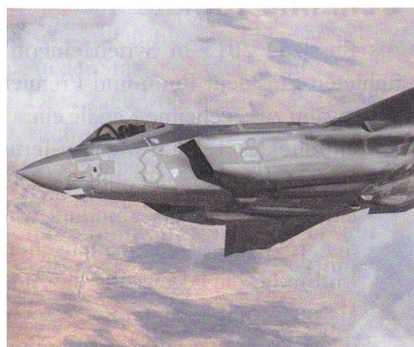
Israels F-35-I Adir (der Mächtige).

Eine offizielle Antwort fehlt. Israelische Beobachter halten fest: