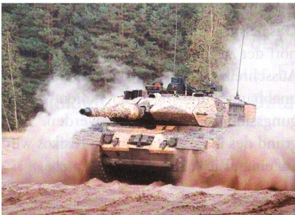
Leopard 2A7V mit Tarnsystem von Saab.

Die Leopard 2A7V, welche ein Konsortium um Krauss-Maffei Wegmann (KMW) zurzeit für die Bundeswehr baut bzw. umrüstet, erhalten das mobile Tarnsystem (Mobile Camouflage System, MCS) von Saab. KMW hat Saab mit der Lieferung der MCS in der Variante Woodland - für bewaldetes Gelände - beauftragt. Die Lieferung soll im Zeitraum 2018 bis 2022 erfolgen. Das MCS des Unternehmensberei-