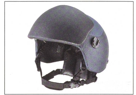
VPAM-6 von ULBRICHT schützt gegen Kalaschnikow-Projektile.

ULBRICHTS Protection hat den weltweit ersten wirksamen VPAM-6-Kopfschutz vorgestellt. Das neue Schutzlevel wird durch die Kombination eines Titanhelms