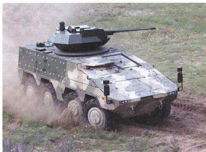
Radschützenpanzer Vilkas in der Erprobung bei den litauischen Streitkräften.

Der litauische Verteidigungsminister hat Ende 2017 drei Fahrschulfahrzeuge Boxer der Öffentlichkeit vorgestellt. Die Fahrzeuge waren kurz zuvor von der ARTEC (Joint Venture von Rheinmetall und Krauss-Maffei Wegmann) an Litauen über-