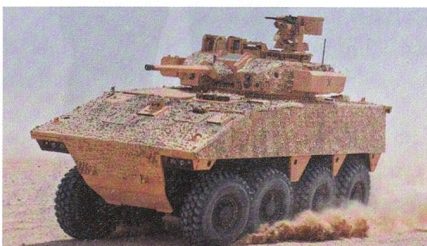
Radschützenpanzer VBCi 2 für Katar.

Katar hat mit Nexter in einer Absichtserklärung die Lieferung von 490 Radschützenpanzern VBCi (Vehicule Blindé de Combat d'Infanterie) vereinbart. Die ver-