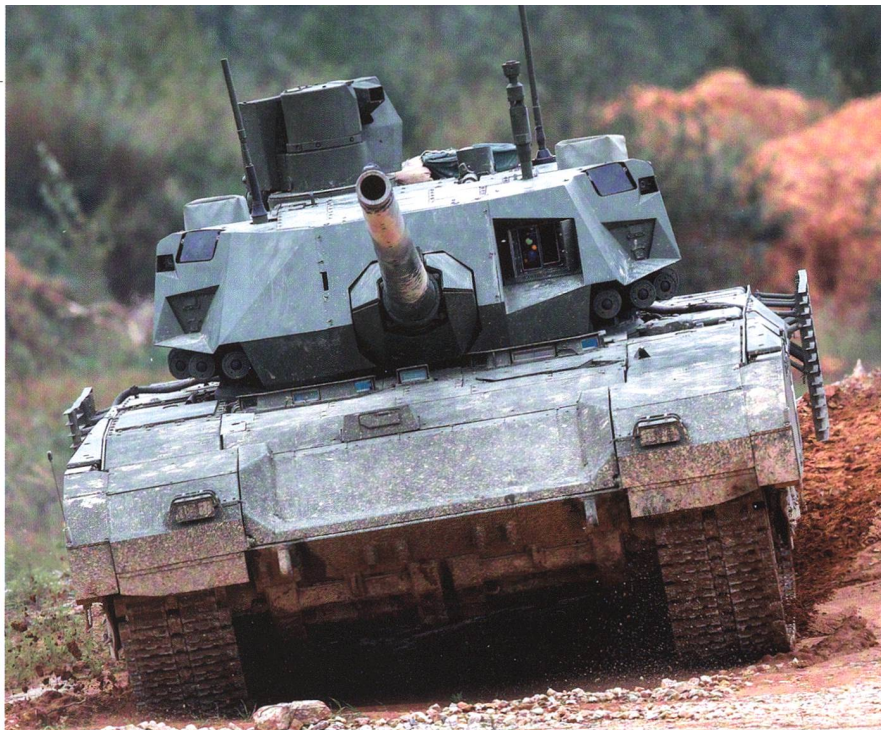
T-14 im Gelände. Die Ketten sind schmaler als beim Leopard oder Abrams.

Mit dieser Technologie könnte der Kdt eines T-14 sogar noch deutlich mehr sehen als der Chef eines Kampfpanzers mit bemanntem Turm. Eine ganz andere Frage ist in diesem Fall aber der Preis: Der Piloten-