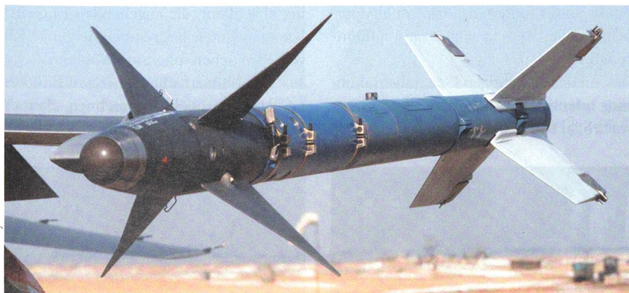
Wie die Amraam-Raketen belasten die Sidewinder-Missile (Bild) die Kosten enorm.