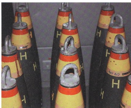
Im wahrsten Sinn des Wortes gewichtig: 155-mm-Granaten der Artillerie.

Das VBS und die Armee fechten noch vor der Juni-Debatte im Parlament den In-