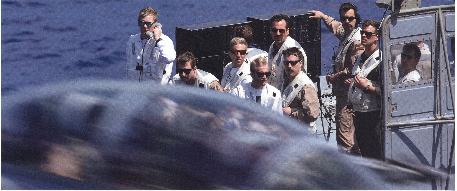
Was folgt, ist kein Präjudiz. In Kampffjet-Analysen wird der F/A-18EF Super Hornet kaum genannt: die Kawestierung des F/A-18CD, von dem die Schweiz 30 besitzt. 40% des Super Hornets sind neu. Derzeit fliegt ihn die US Navy – hier am 18. Mai 2018 ein F/A-18EF bei der Landung auf dem Flaggschiff der Carrier Strike Group 8, der USS Harry S. Truman (CVN 75).