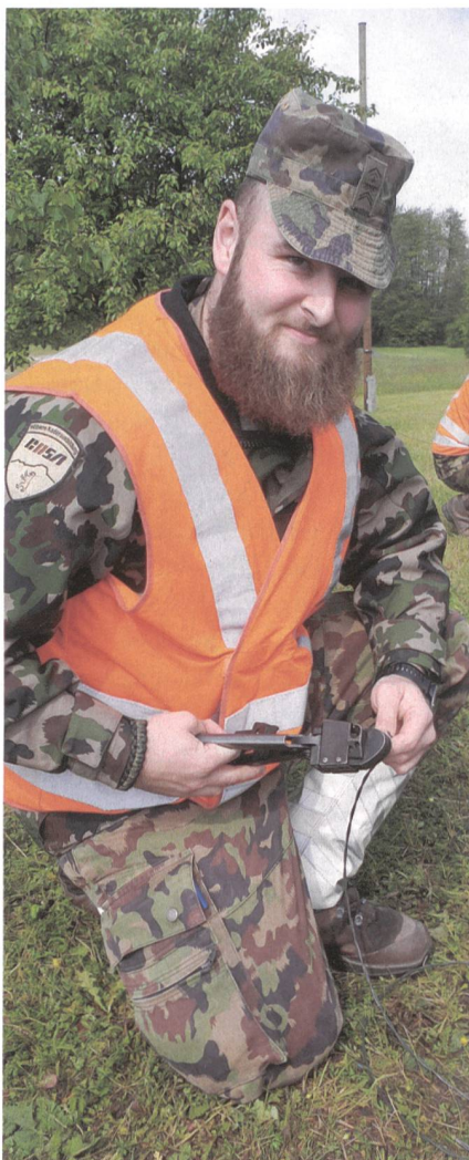
F2E(K) Draht am Vorbereiten. Fast wie damals in meiner Lehre.

Wir haben gelernt, wie man eine Unterrichtseinheit plant, durchführt, auswertet und nachbearbeitet. Es gehört mehr dazu, als kurz ein Reglement in die Hand zu nehmen und zu glauben, man könne eben kurz mal etwas aus dem Ärmel schüttern! Ich durfte vergangene Woche meine erste Musterlektion im Bereich Gefechtsformationen zum Besten geben. Es wäre an