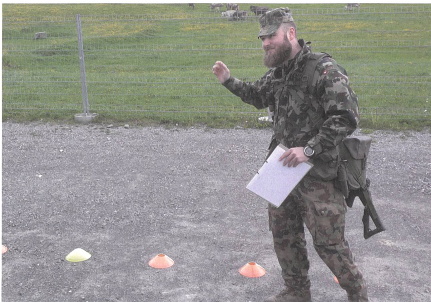
Musterlektion Formationen, Raum Rossstallungen Herisau.

gut. Schliesslich ist diese Thematik Teil der Allgemeinen Grundausbildung. Für zukünftige Berufsunteroffiziere ist der Übermittlungsdienst ein nicht zu unterschätzender Teilbereich, egal in welcher Truppengattung man eingesetzt wird.