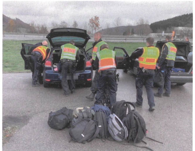
Bei sehr konkreten Verdachtsfällen wird arbeitsteilig vorgefahren, um rasch Fakten zu schaffen.

lich bestimmte Umgangston der Kontrollteams, die gerne auch aufklären und Geduld walten lassen bei etwas gestressten Menschen. Freude bereitet einem als Beobachter wie unsere Grenzwächter auch auf deutschem Gebiet engagiert und zielgerichtet arbeiten. Mit ihren neuesten digitalen Möglichkeiten mittels Handy sind sie den deutschen Kollegen punkto Schnelligkeit überlegen.