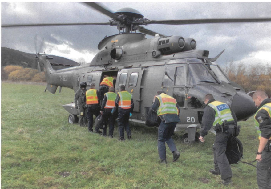
Die Beamten verschieben per Lufttransport.

Angefangen hat diese Methode in der Schweiz 2009 nach einem Arbeitsbesuch des Grenzwachtkommandanten in Ostdeutschland. Es wurden aber helvetische Anpassungen am Konzept vorgenommen, wie die Kombination von heliportierten und terrestrischen Mitteln. Die Rhein- und Bodenseegrenze und das Engadin eignen