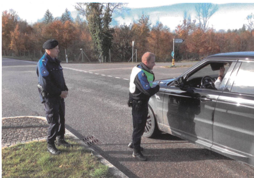
Die Vorselektion ist entscheidend. Dafür braucht es Erfahrung und Menschenkenntnis.