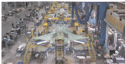
F-35-Fertigungsstrasse in Fort Worth.

Das F-35 Joint Program Office und Lockheed Martin haben eine Vereinbarung über die Lieferung von 478 Lightning II im Wert von 34 Milliarden Dollar geschlossen. Sie betrifft die Produktionslose 12 bis 14. Laut Lockheed Martin enthält der Deal weitere Preissenkungen für den Stealth-Fighter auf 77,9 Millionen Dollar für die F-35A, 101,3 Millionen für die F-35B und 94,4 Millio-