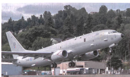
Übergabe des ersten Seeaufklärers Poseidon MRA1 an die Royal Air Force.

Das erste U-Boot-Jagdflugzeug Poseidon MRA1 wurde in Jacksonville von der Royal Air Force übernommen. Nach über acht Jahren verfügt das britische Militär damit wieder über einen Seefernaufklärer. Nach einer Zeremonie bei Boeing in Seattle wurde das Flugzeug zur Naval Air Station Jacksonville in Florida geflogen, wo RAF-Personal für den Betrieb des Flugzeugs