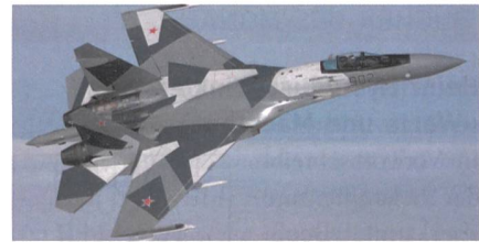
Suchoi Su-35 für die Türkei?

Die Türkei ist für die Vereinigten Staaten von Amerika kein zuverlässiger Militärpartner mehr, daher hat man das Land aus dem F-35 Programm ausgeschlossen. Als Hauptgrund dafür gilt der Kauf des russischen S-400 Flugabwehrsystems. Die USA