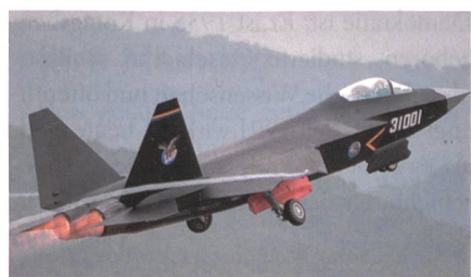
Chinesisches Stealth-Kampfflugzeug AVIC FC-31.