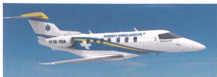
Pilatus PC-24 als Ambulanzflugzeug.

Die Schwedische Rettungsflugorganisation KSA hat sich für den Kauf von sechs Pilatus PC-24 in vollständig ausgerüsteter Ambulanzkonfiguration entschieden. Die PC-24 werden ab 2021 die flugmedizinische Versorgung in ganz Schweden ermöglichen. Die 21 Provinzen Schwedens haben sich zur