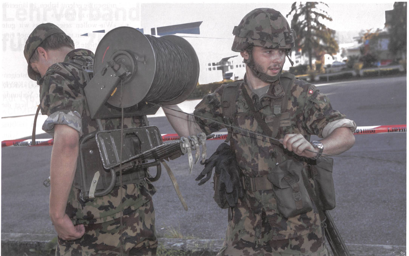
Ein traditionelles Bild vom Engagement unserer Silbergrauen. Kameraden im Einsatz.