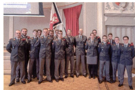
«Sie haben die beste Führungsausbildung der Schweiz bestanden»: Der designierte Chef der Armee, Divisionär Süssli, gratulierte den jungen Artillerieleutnants zur Beförderung.