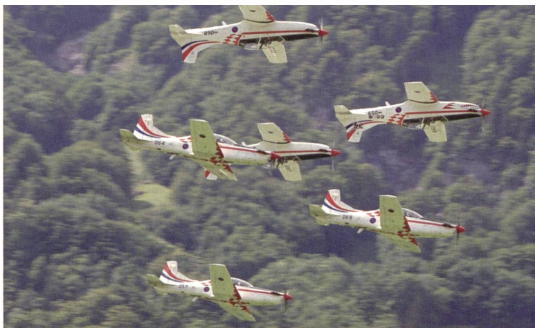
Das kroatische Kunstflugteam «Kрила Oluje» mit Pilatus PC-9M.