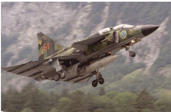
Der Viggen in grüner Tarnbemalung wurde stark beachtet.