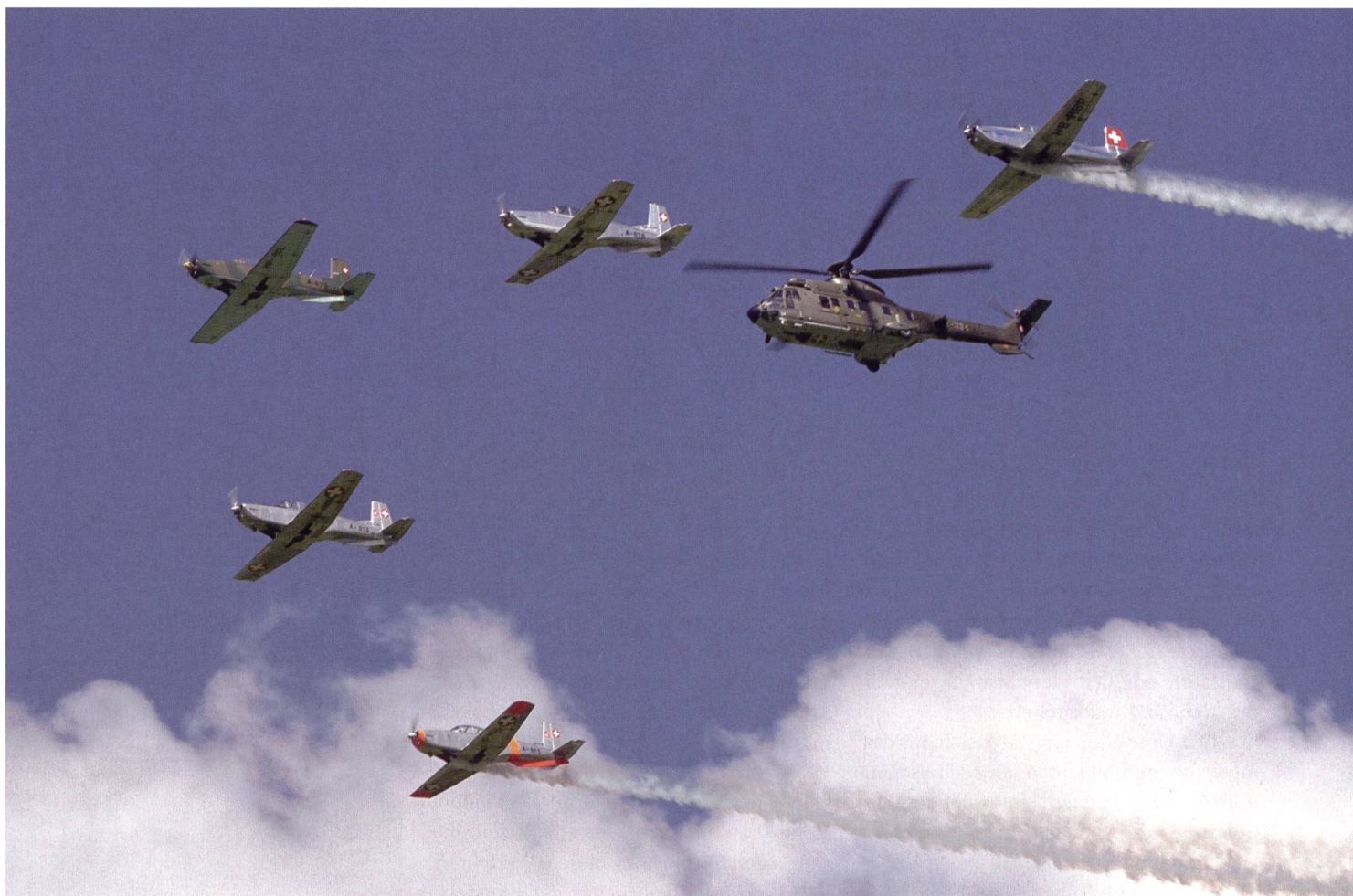
Die P3 Flyers aus dem Tessin beim gemeinsamen Überflug mit dem Cougar des Super Puma Display Team der Luftwaffe, diese spezielle Formation war eine Premiere.