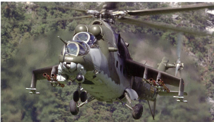
Noch immer eine gewaltige Kampfmaschine: Der Helikopter Mi-35 (ex-Mi-24).