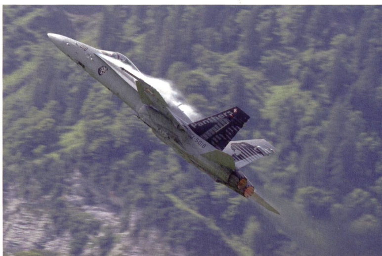
Die Staffelmachine J-5018 der Fliegerstaffel 18 in Mollis.