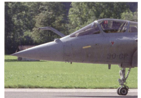
Was andere in Payerne konnten, kann Dassault auch: mit Schweizerfahne!