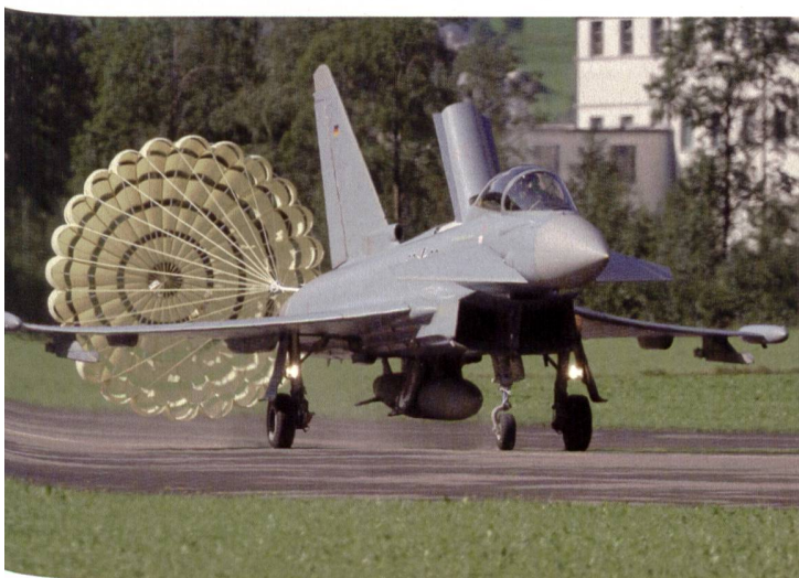
Ein Eurofighter Thyphoon landet in Mollis mit Bremschirm.