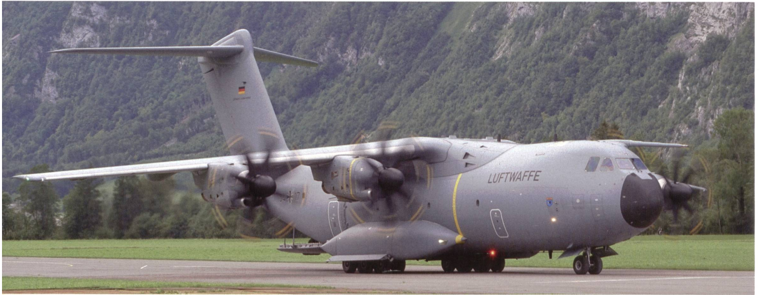
Die mächtige A400M-Transportmaschine von Airbus gehörte zu den Attraktionen. Ein Flugzeug der deutschen Luftwaffe.