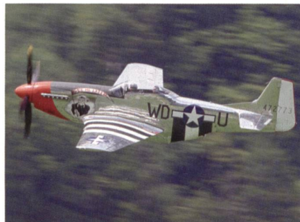
P-51 «Mustang», ein Klassiker mit schönem Motorensound.