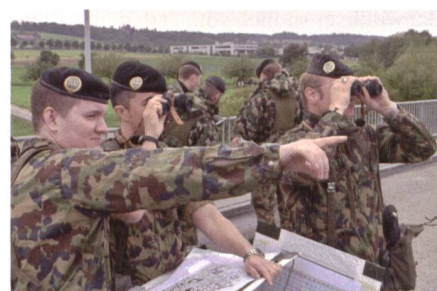
Auf der A-7-Brücke direkt am Zoll.

Folgerichtig zog der Kdt Mech Bat 14 von Osten nach Westen eine interne Abschnittsgrenze – auf der Wasserscheide des Seerückens. Er teilte seine Kräfte auf: