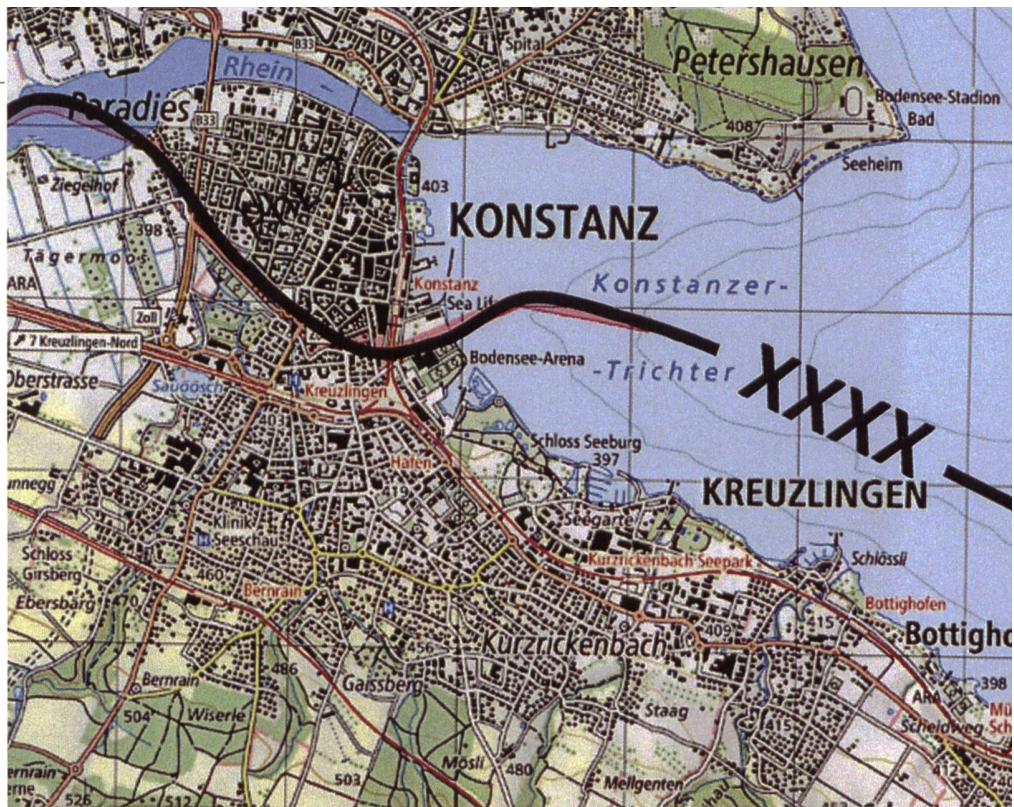
Die Grenzstädte Kreuzlingen (21 900 Einw.) und Konstanz (87 100) bilden am Westende des Bodensees einen Riegel. Die Altstadt Konstanz ist das einzige deutsche Gebiet südlich vom Rhein. Kreuzlingen bildet eine respektable «Barriere» auf Schweizer Gebiet. Südlich schliesst sich der Seerücken an.

Der blaue Kdt Mech Bat 14 erhielt den Auftrag, den feindlichen Stoss entlang des Sees und auf dem Seerücken um mindestens 15 Stunden zu verzögern; den Gegner daran zu hindern, gegen Süden an die Thur auszubrechen und blaue Verbände im Raum Kreuzlingen einzuschliessen;