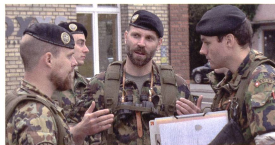
Am Kreisel westlich des Bahnhofes.

vorkommen, dass die Kampfkraft zu sehr sinkt. Andererseits erfordert die Verzögerung Reserven für die Gegenanriffe.