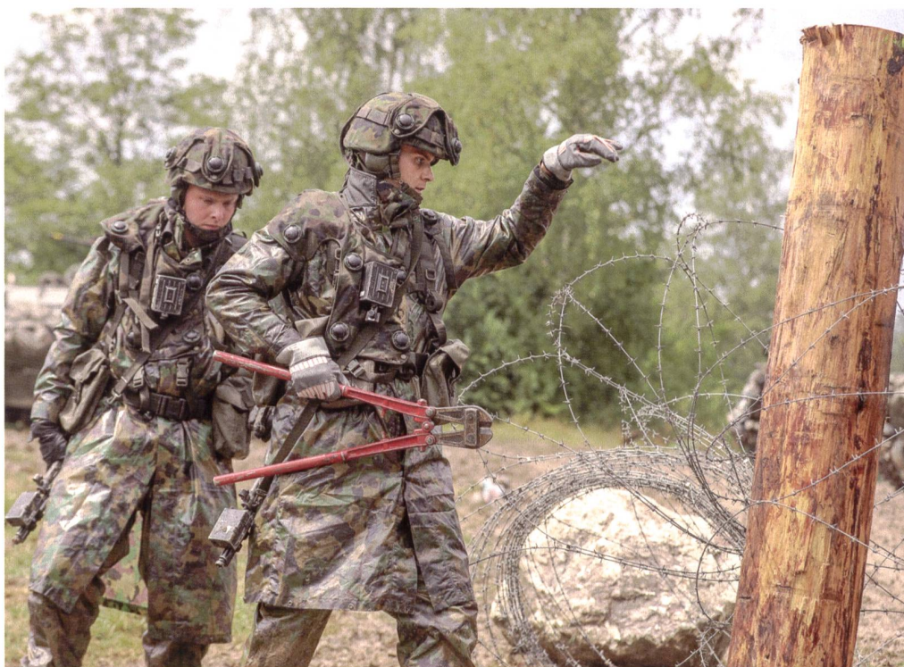
Hindernisbau für die Panzersappeure.