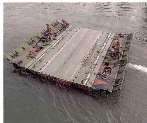
Drei Pontioniere bringen ein Modul der Schwimmbrücke in Position.

Bis unmittelbar vor KVK-Beginn werde dispensiert, und in einem Fall sei ein Zivi-Gesuch eingegangen, nachdem der Kdt vordienstlich die Sonntagswachen zugeteilt habe.