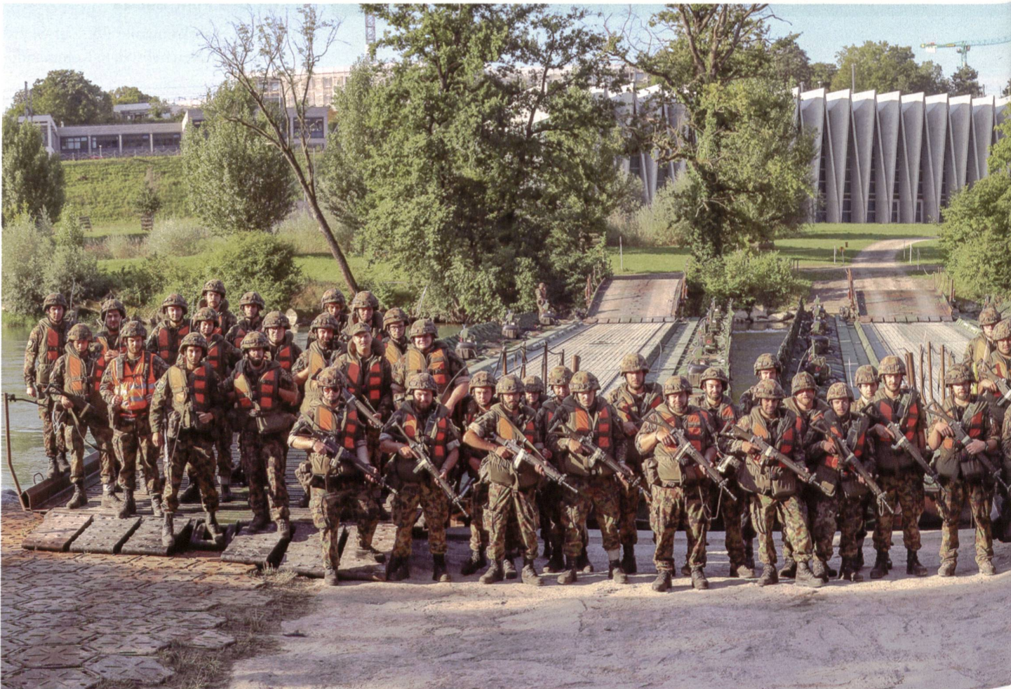
Eine Pontonierkompanie mit Helm, Sturmgewehr und oranger Schwimmweste.