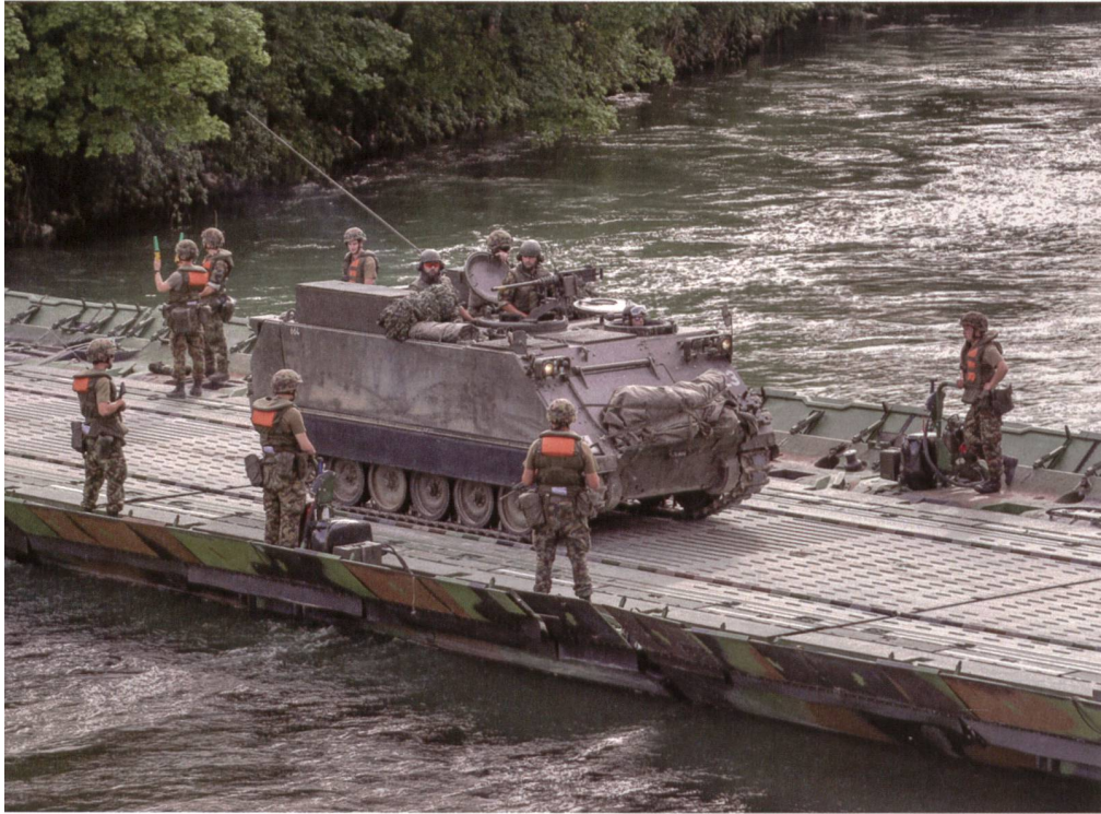
Gut geführt von Pontonieren: ein Schützenpanzer M-113.