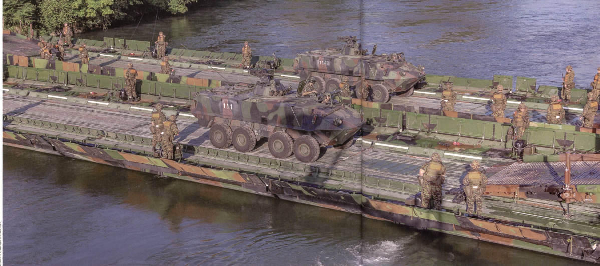
Zwei Piranha-Radschützenpanzer überqueren die Doppelbrücke des Pont Bat 26.