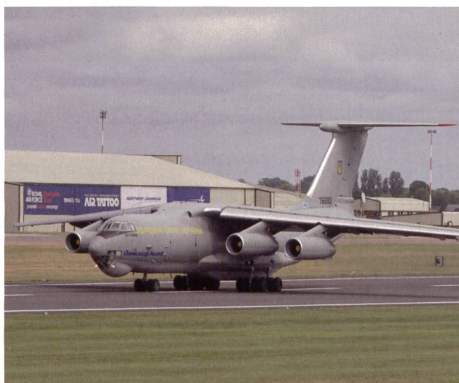
Vierstrahlige IL-76 Transportmaschine aus der Ukraine.