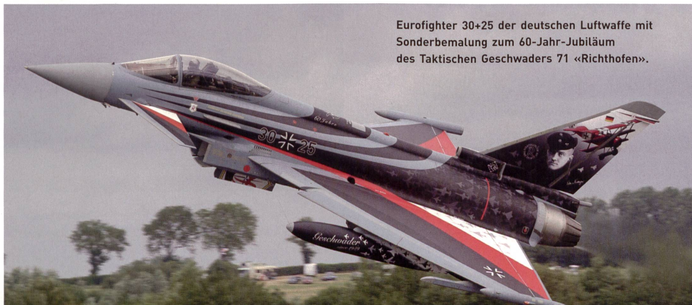
Eurofighter 30+25 der deutschen Luftwaffe mit Sonderbemalung zum 60-Jahr-Jubiläum des Taktischen Geschwaders 71 «Richtofen».