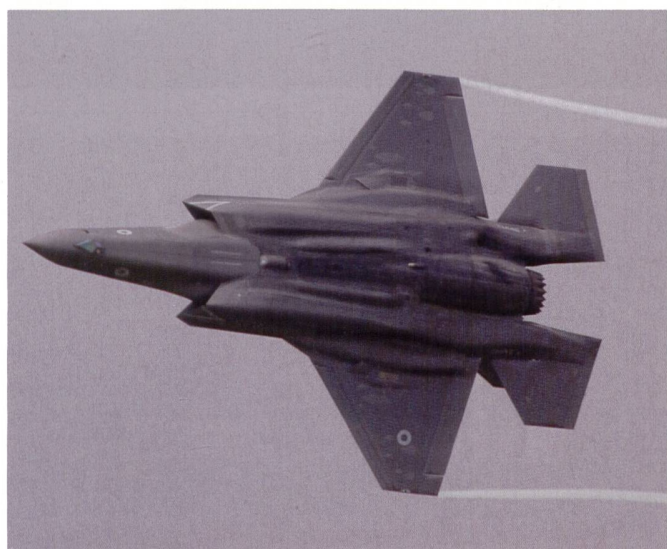
F-35B der Royal Air Force 617 Squadron.