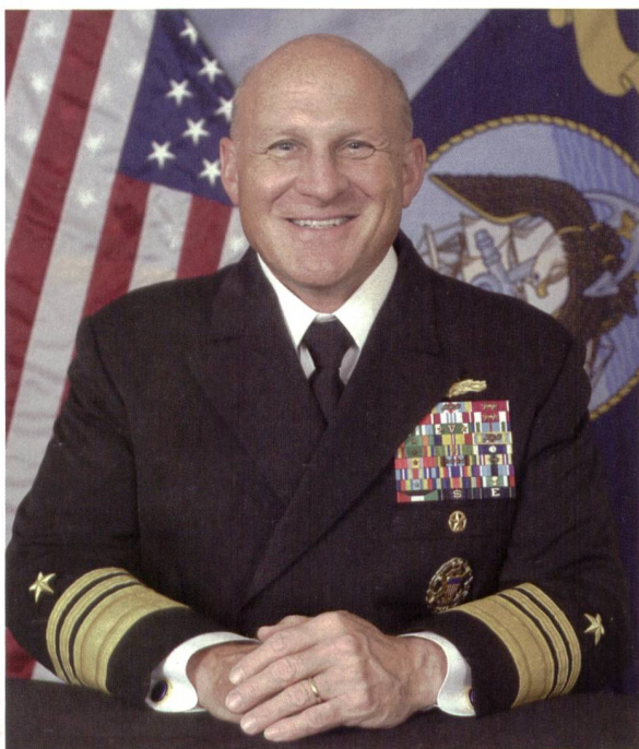
Vizeadmiral Michael M. Gilday.