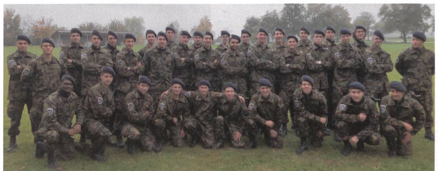
Das Bild des Rekrutenzugs 4 am 26. Oktober 2018, am letzten Tag der RS.