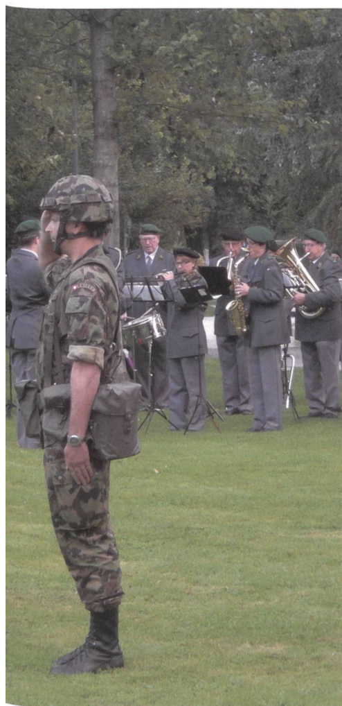
Guisan-Wiese am Lido der Stadt Luzern.

versammlung zum General gewählt – ein militärischer Dienstgrad, den es in der Armee in Friedenszeiten nicht gibt.