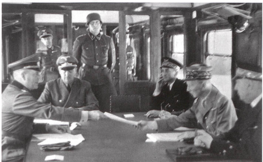
22. Juni 1940, im Salonwagen: Feldmarschall Keitel überreicht den geschlagenen Franzosen den Vertrag zum Waffenstillstand (unscharfes historisches Bild).