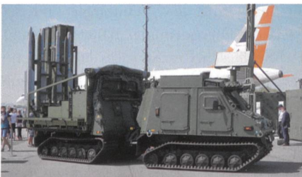
IRIS-T SLS auf Hägglunds Bv410.

Die griechische INTRACOM Defense Electronics (IDE) hat angekündigt, die Zusammenarbeit mit dem deutschen Unternehmen Diehl Defence durch die Unterzeichnung eines Fünfjahres-Rahmenvertrages im Wert von 10 Millionen Euro