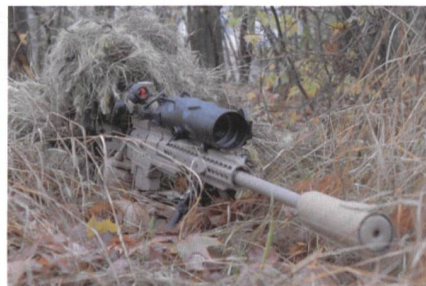
Scharfschützengewehr SSG M1.

Das österreichische Bundesheer hat sein neues mittleres Scharfschützengewehr Steyr Mannlicher SSG M1 offiziell übernommen. Das Steyr Mannlicher SSG M1 für das Bundesheer verschießt das Kaliber .338 Lapua Magnum (8,6 × 70 mm). Der Repeatingverschluss bietet