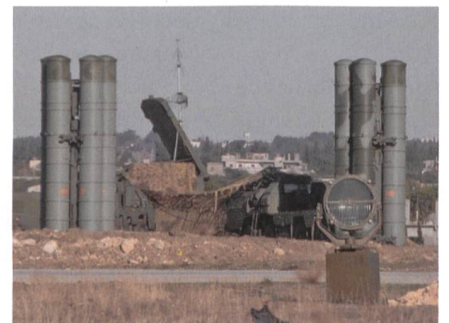
Russisches Raketenabwehrsystem S-400.

Indiens Streitkräfte beschaffen im Rahmen eines 5,43 Milliarden-Dollar-Programms fünf S-400 Triumpf-Raketenab-