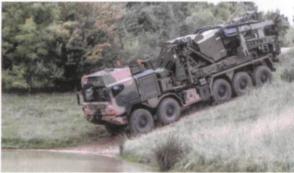
Dry Support Bridge von WFEL.

Im Programm Land 155 der australischen Streitkräfte hat die KMW-Tochter WFEL im Teilprojekt zur Verbesserung der Fähigkeiten mit Gefechtsfeldbrücken das erste Los mit schnell verlegbaren Brücken, Dry Support Bridges (DSB) und Medium Girder Bridges (MGB) ausgeliefert. Als Trans-