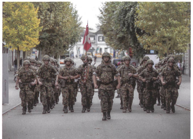
In tadelloser Ordnung defiliert das Aufklärungsbataillon 1 durch die wehrfreundliche, geschichtsträchtige Stadt Solothurn. Vorne mit der Standarte der Bataillonsstab.