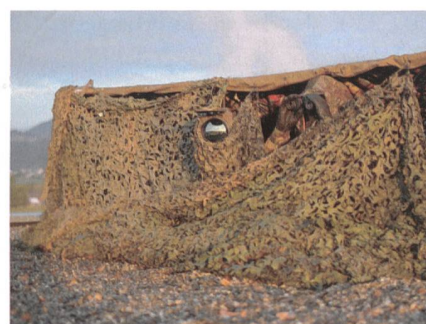
Gut getarnt: Beobachtungsposten auf dem Dach des Flugplatzes Grenchen