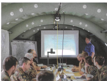
Der Abspracherapport mit den zivilen Behörden des Kantons Solothurn.