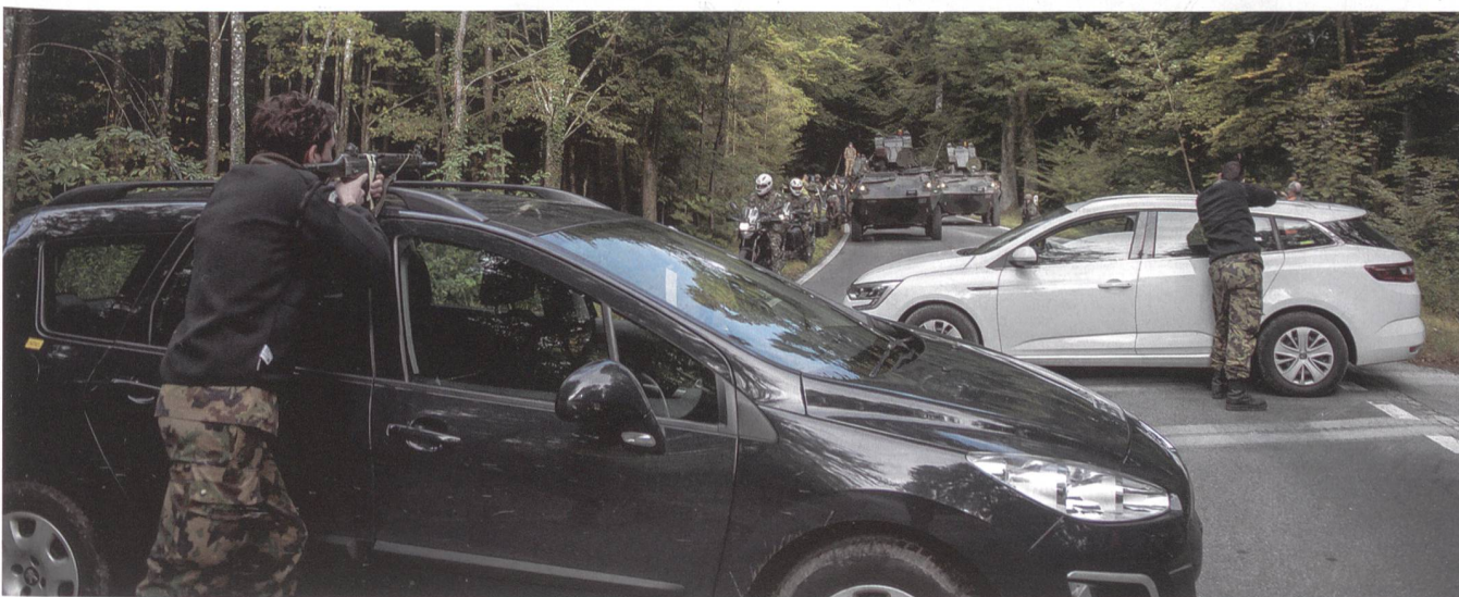
Dramatische Zuspitzung auf dem Weg vom Flugplatz zum Konferenzstandort: Der VIP-Konvoi gerät in einen Hinterhalt!