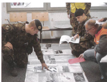
Mit dem Chef Sicherheit des Migros-Verteilbetriebs: Das Schutzdispositiv.