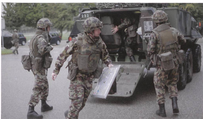
Die Sicherungsmannschaft bringt sich in Stellung.