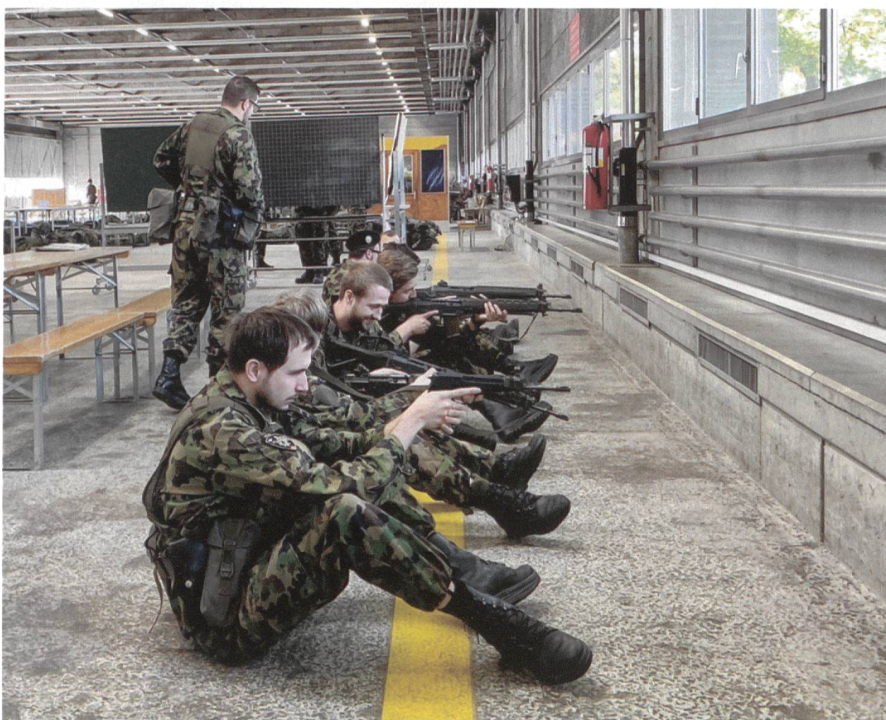
Übung macht den Meister. Training an der persönlichen Waffe.

Solche Echteinsätze werden von den Soldaten und Kadern immer geschätzt, da sie ihr Können vielen hochrangigen Offizieren unter Beweis stellen können.